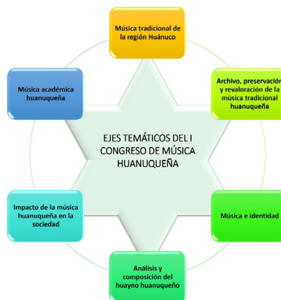
Ejes temáticos del I Congreso de Música Huanuqueña